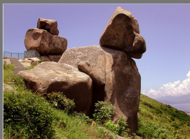
青少年組 亞軍 南丫島小狗 陳俊穎