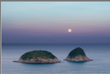
公開組 季軍 月出大洲尖洲 - 西貢 翟岳