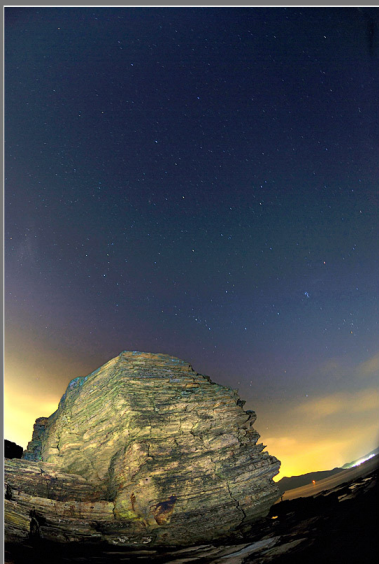
公開組 亞軍 星空下的更樓石 - 東平洲 楊霆鋒