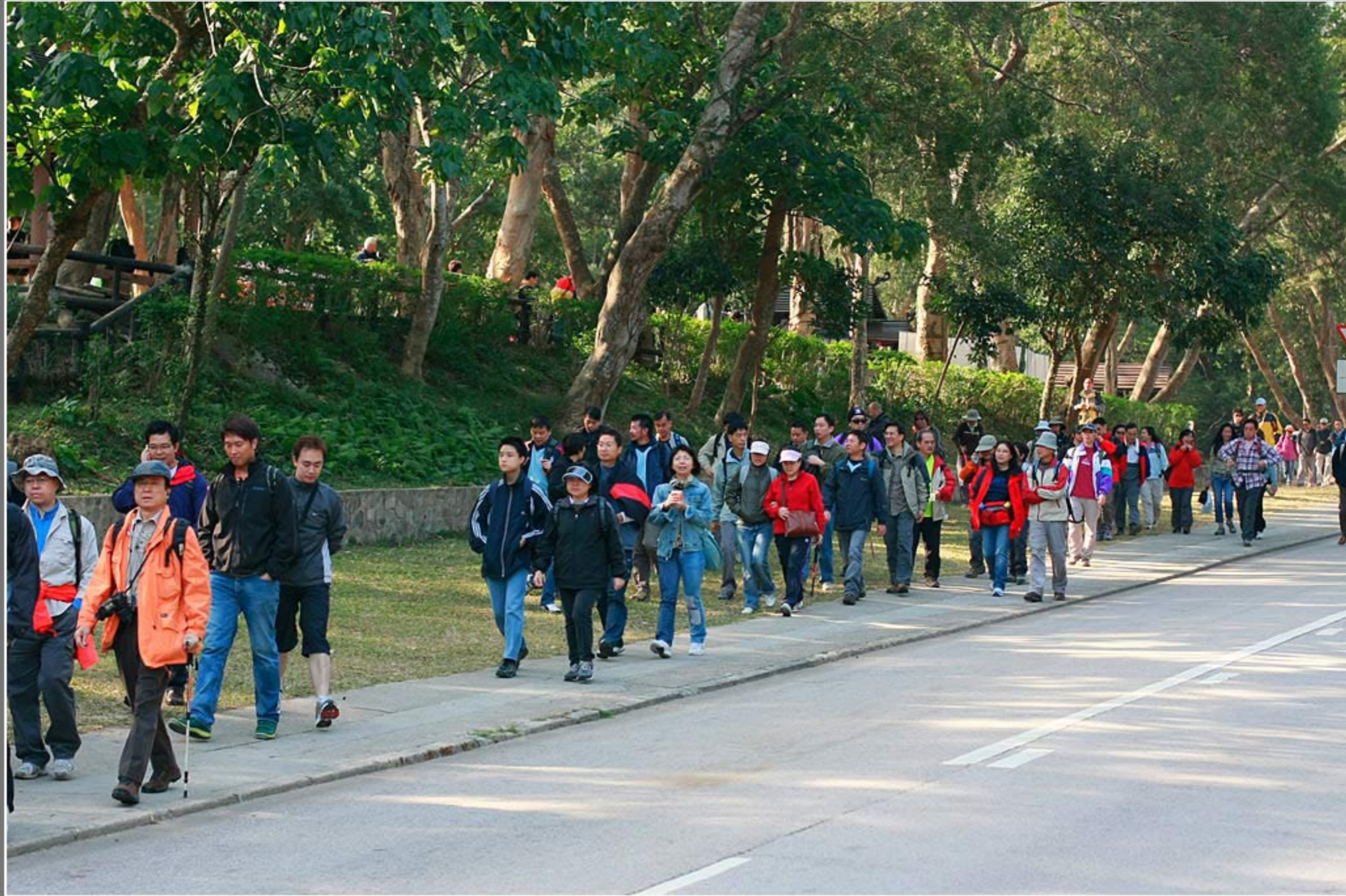
新創建西貢地貌行 - 沿途