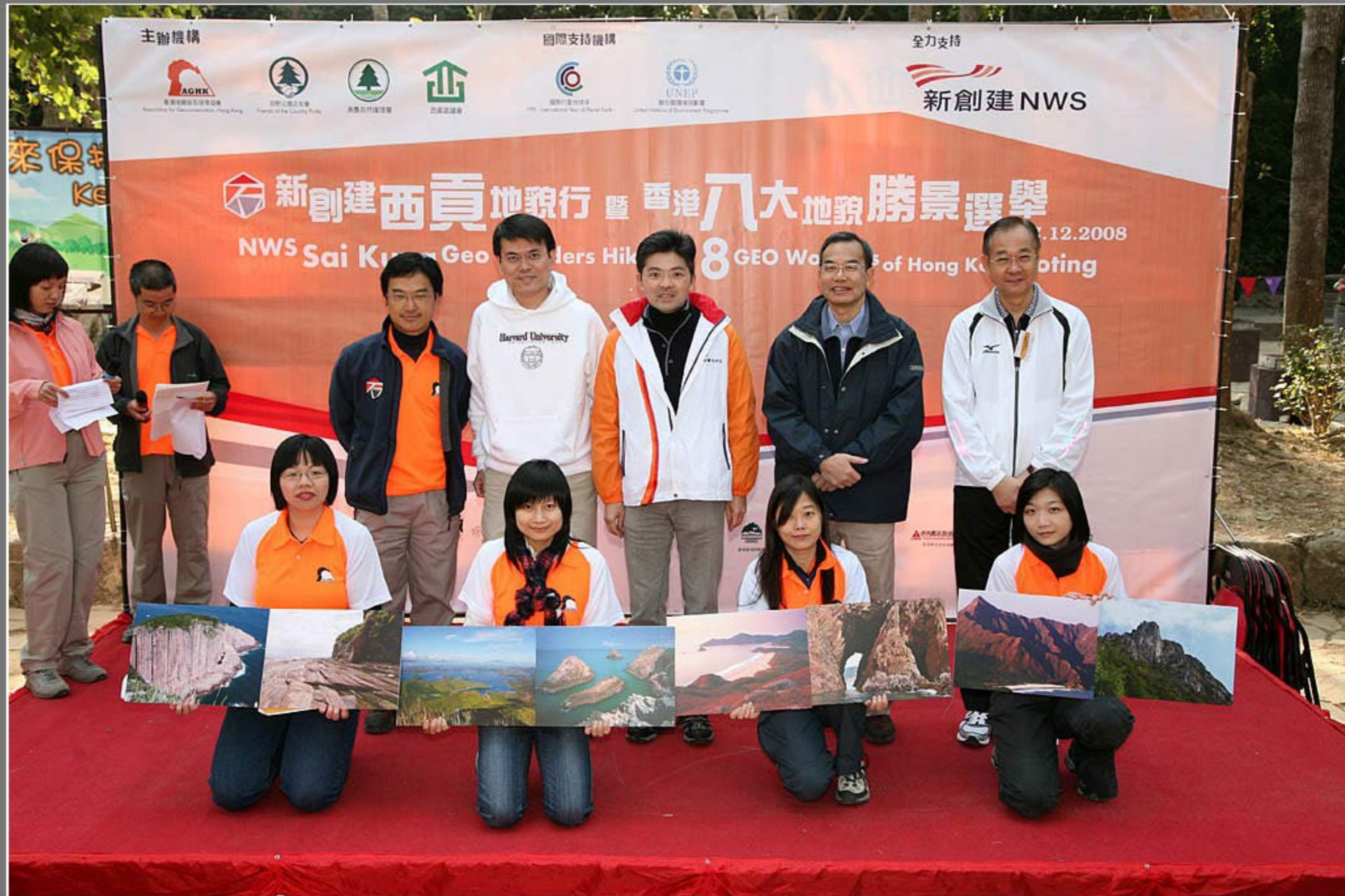
香港八大地貌勝景選舉頒獎禮暨新創建西貢地貌行典禮