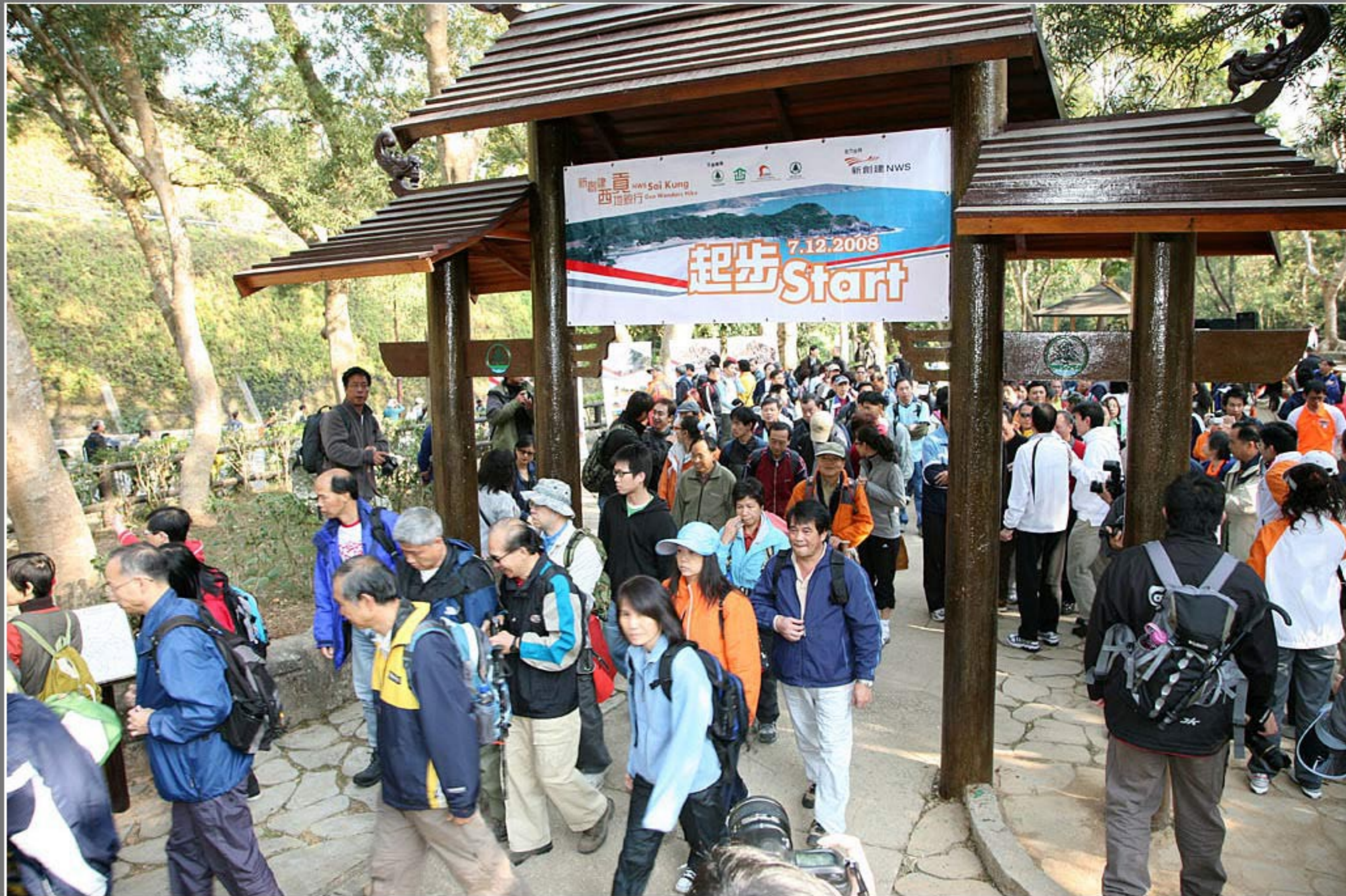
新創建西貢地貌行 - 齊起步