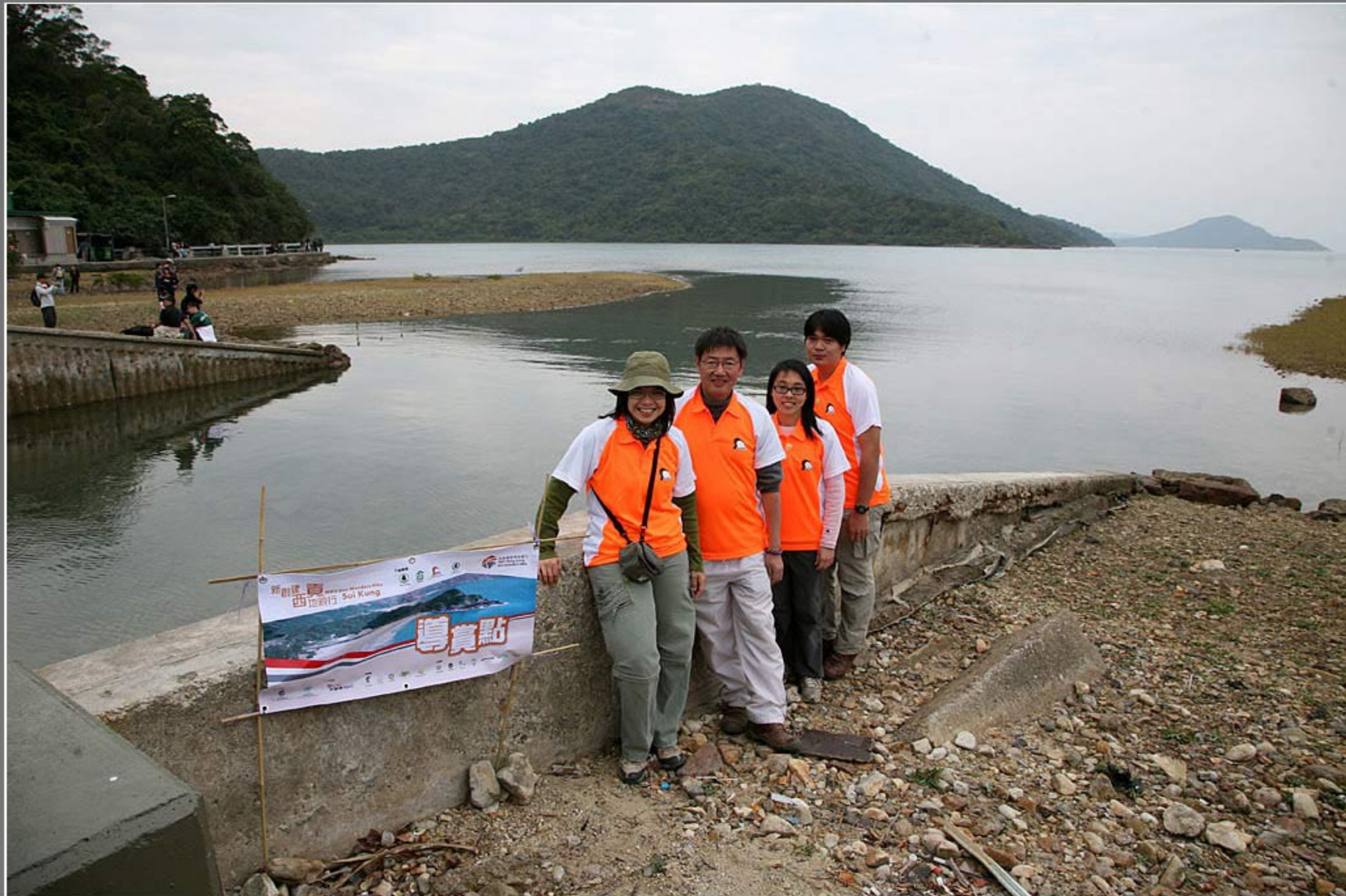
導賞點五 赤徑 - 解說斷裂, 河口的形成, 泥灘生態