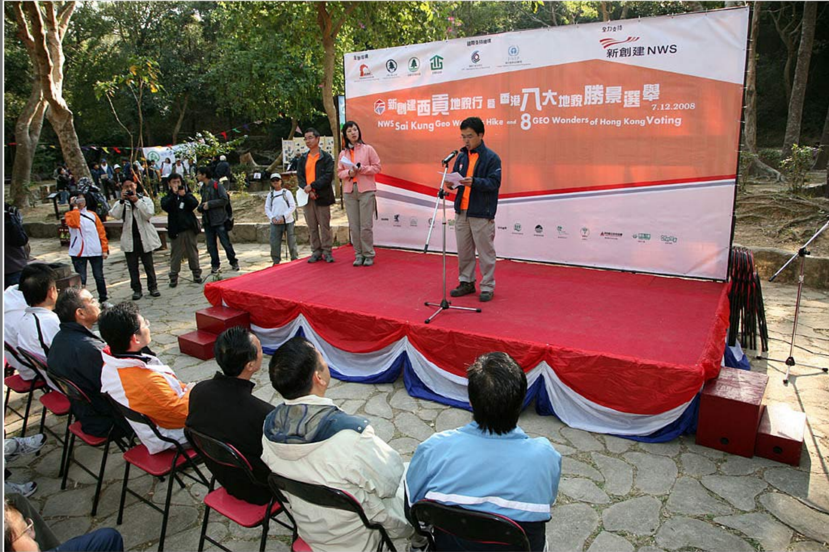
香港八大地貌勝景選舉頒獎禮暨新創建西貢地貌行典禮