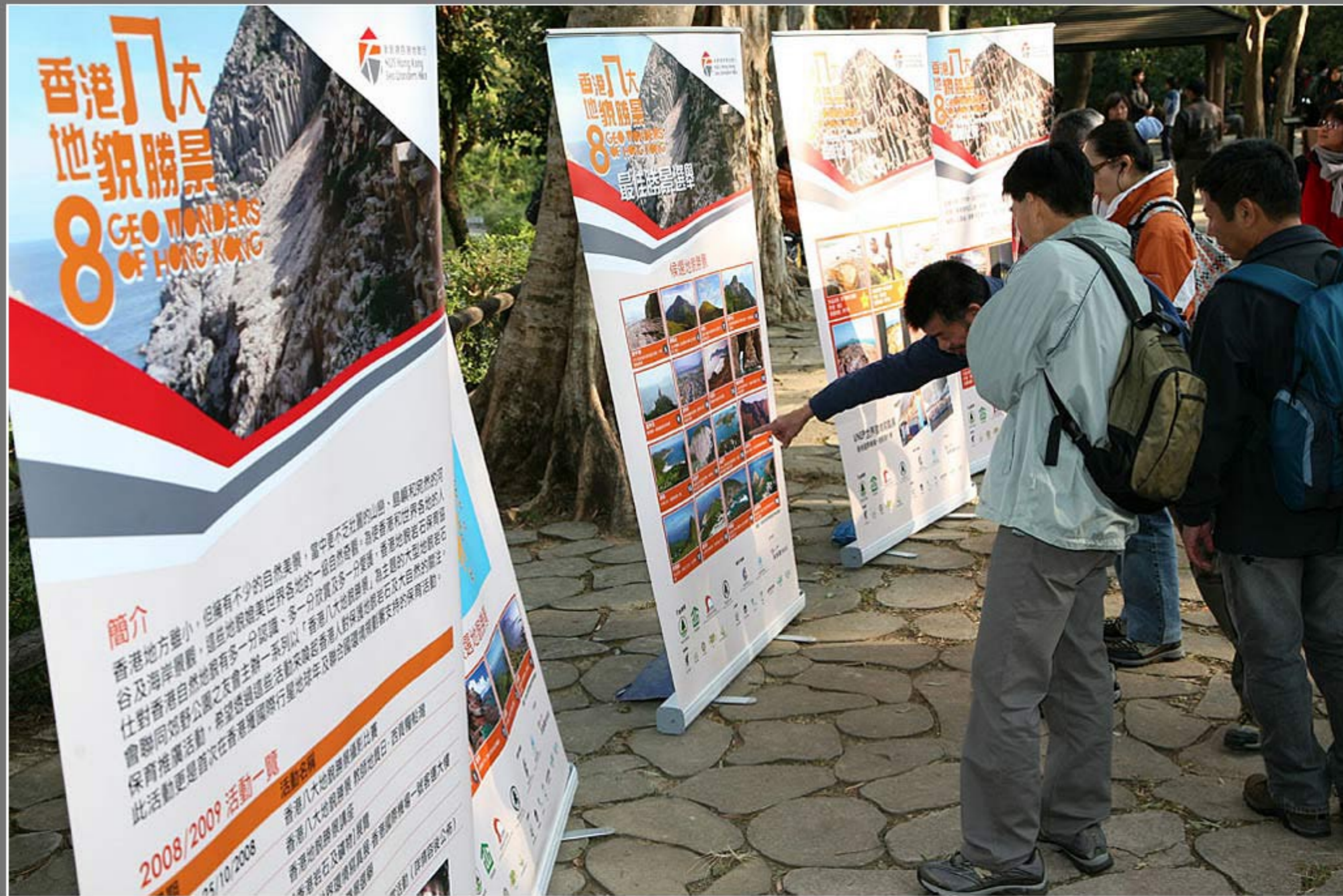
香港八大地貌勝景選舉頒獎禮暨新創建西貢地貌行典禮