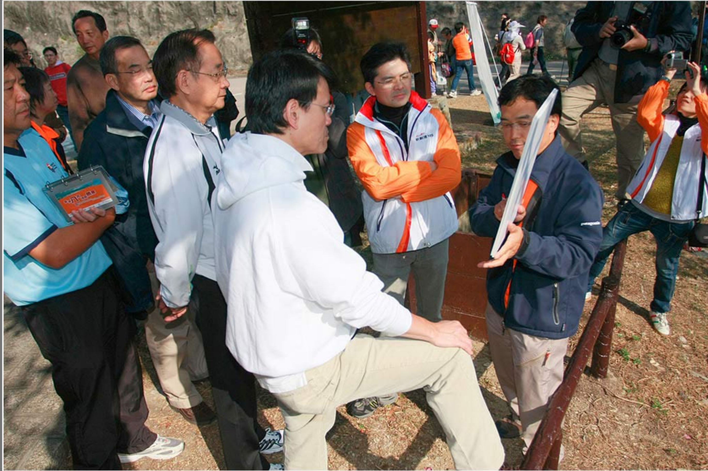
Young sir 地貌解說