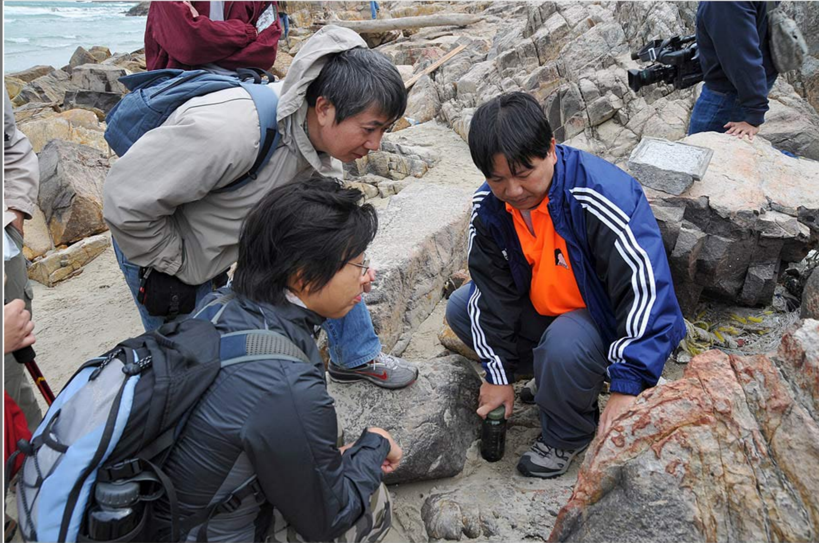
導賞點一 - 西灣 - 解說火山岩, 節理, 侵蝕