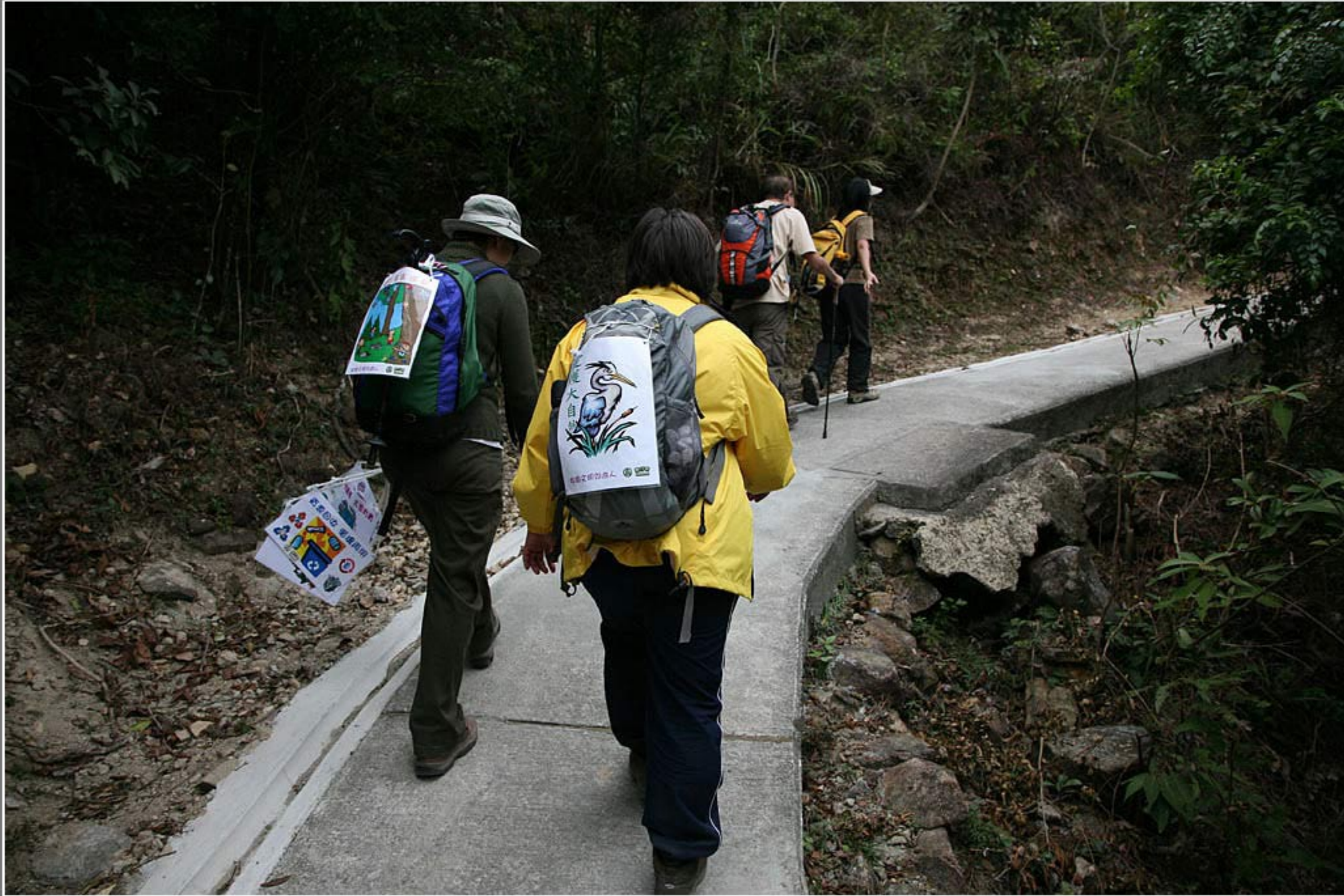
新創建西貢地貌行 - 沿途