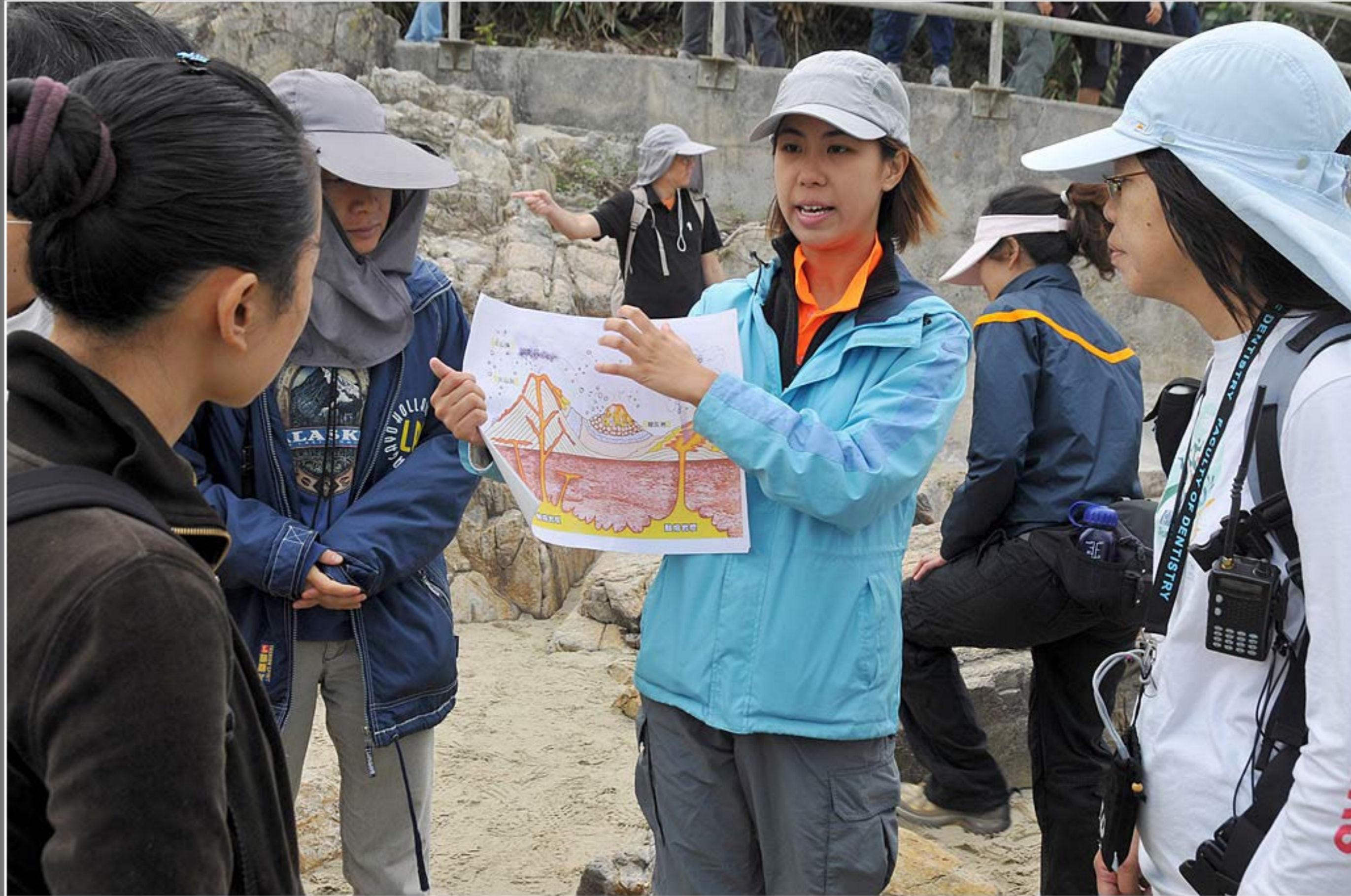
導賞點一 - 西灣 - 解說火山岩, 節理, 侵蝕