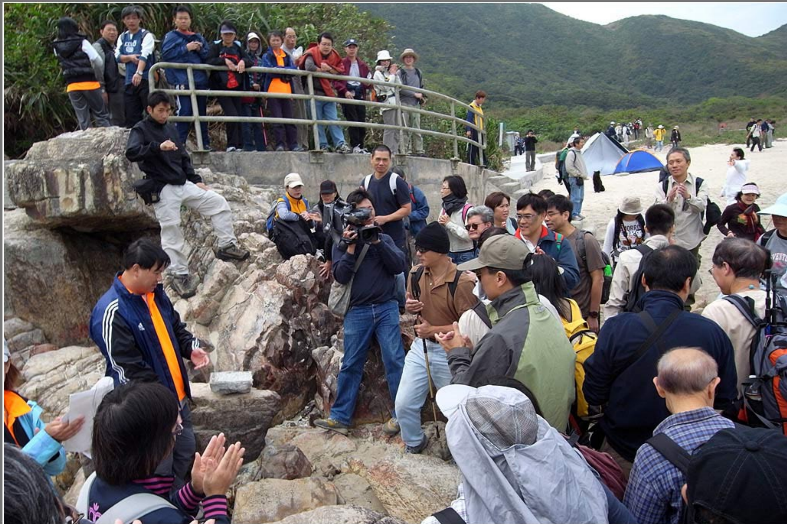
參加者的鼓掌