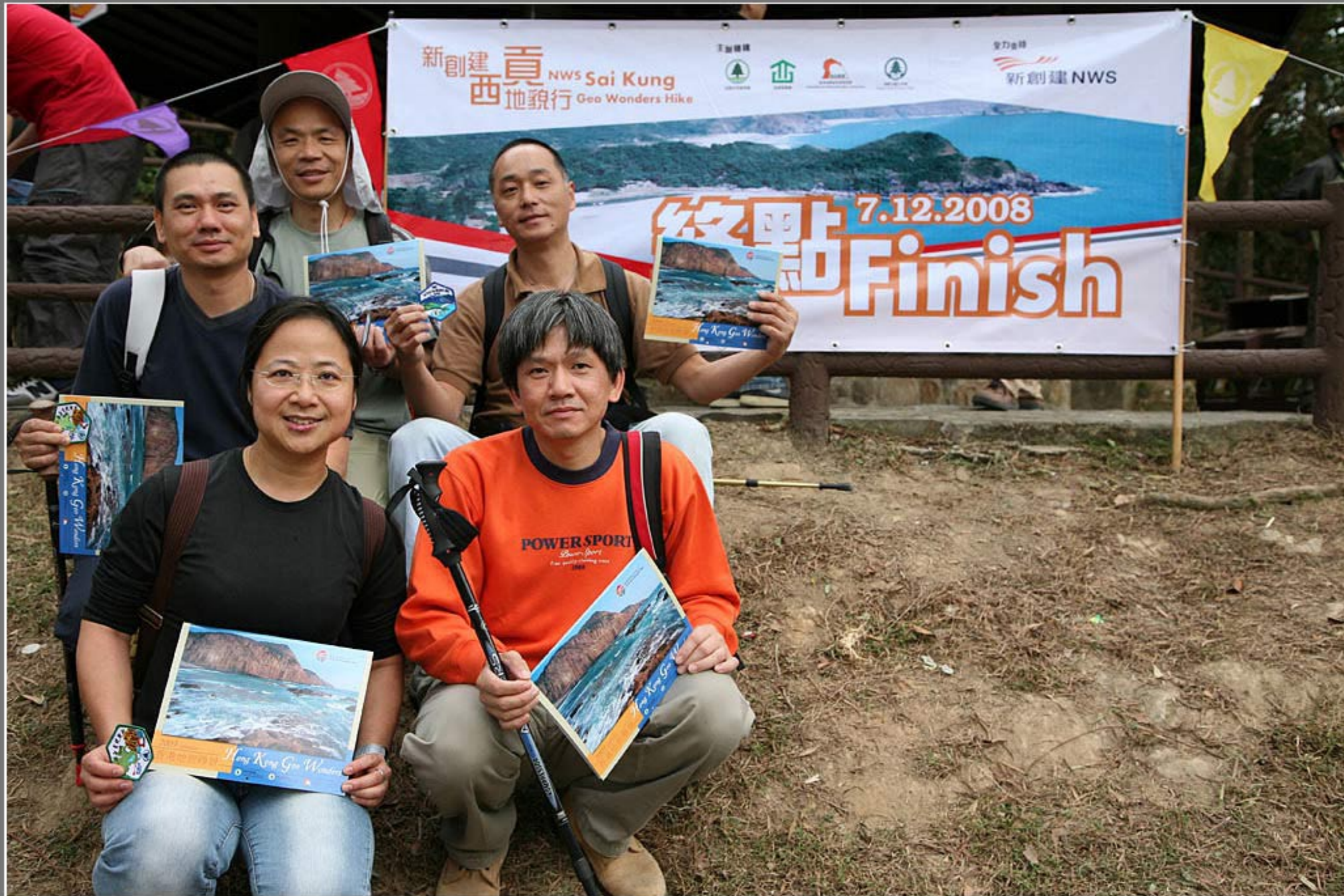
新創建西貢地貌行 - 終點