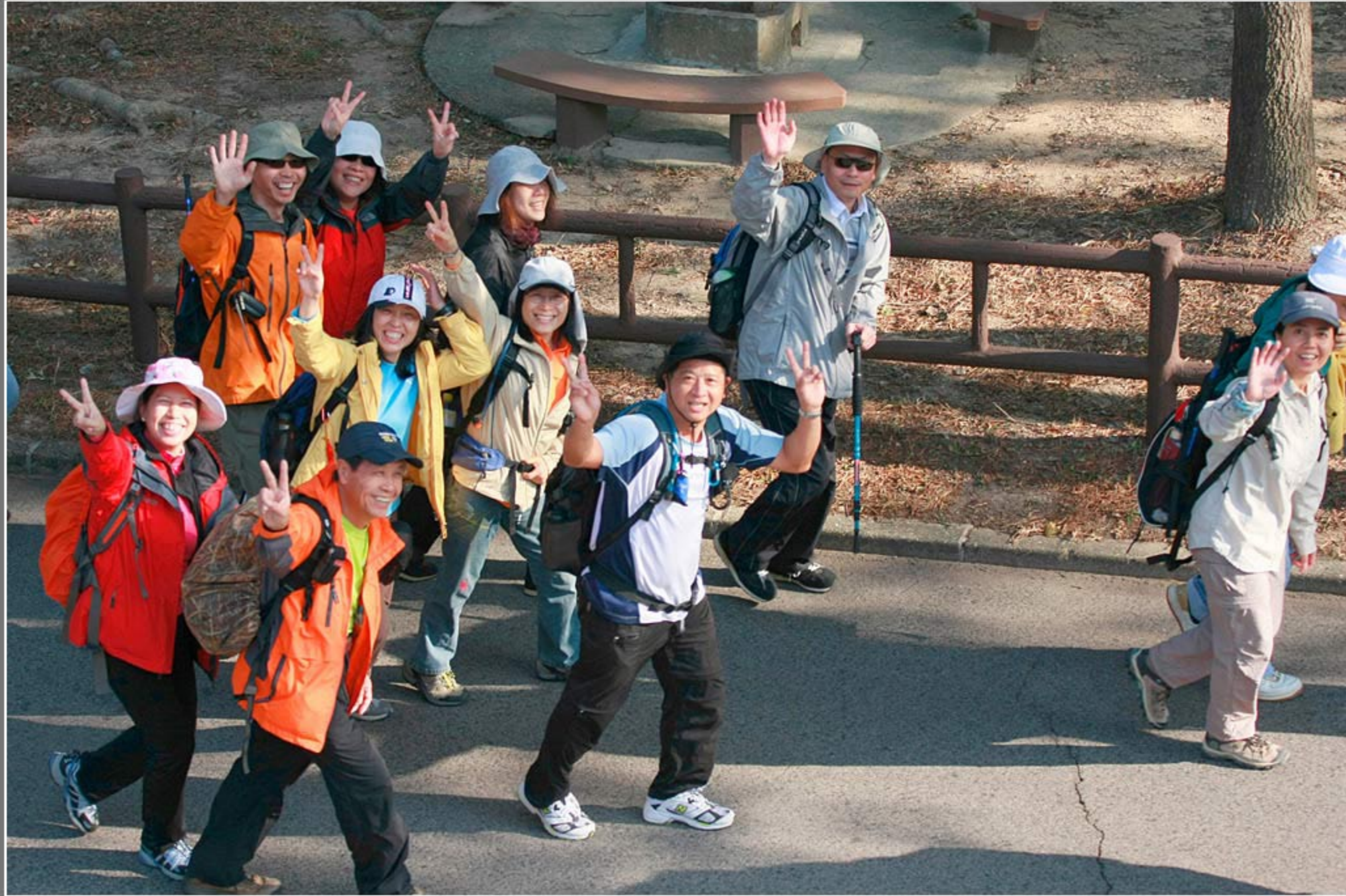
新創建西貢地貌行 - 沿途