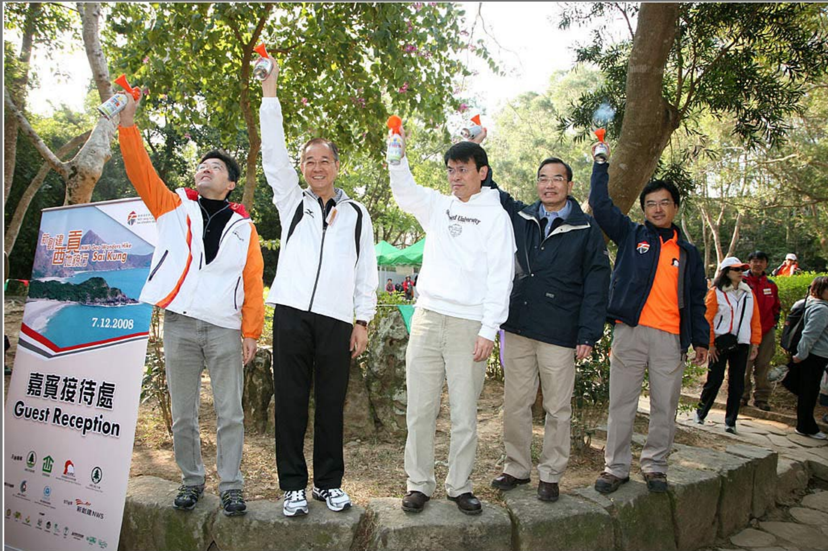
新創建西貢地貌行 - 開步禮