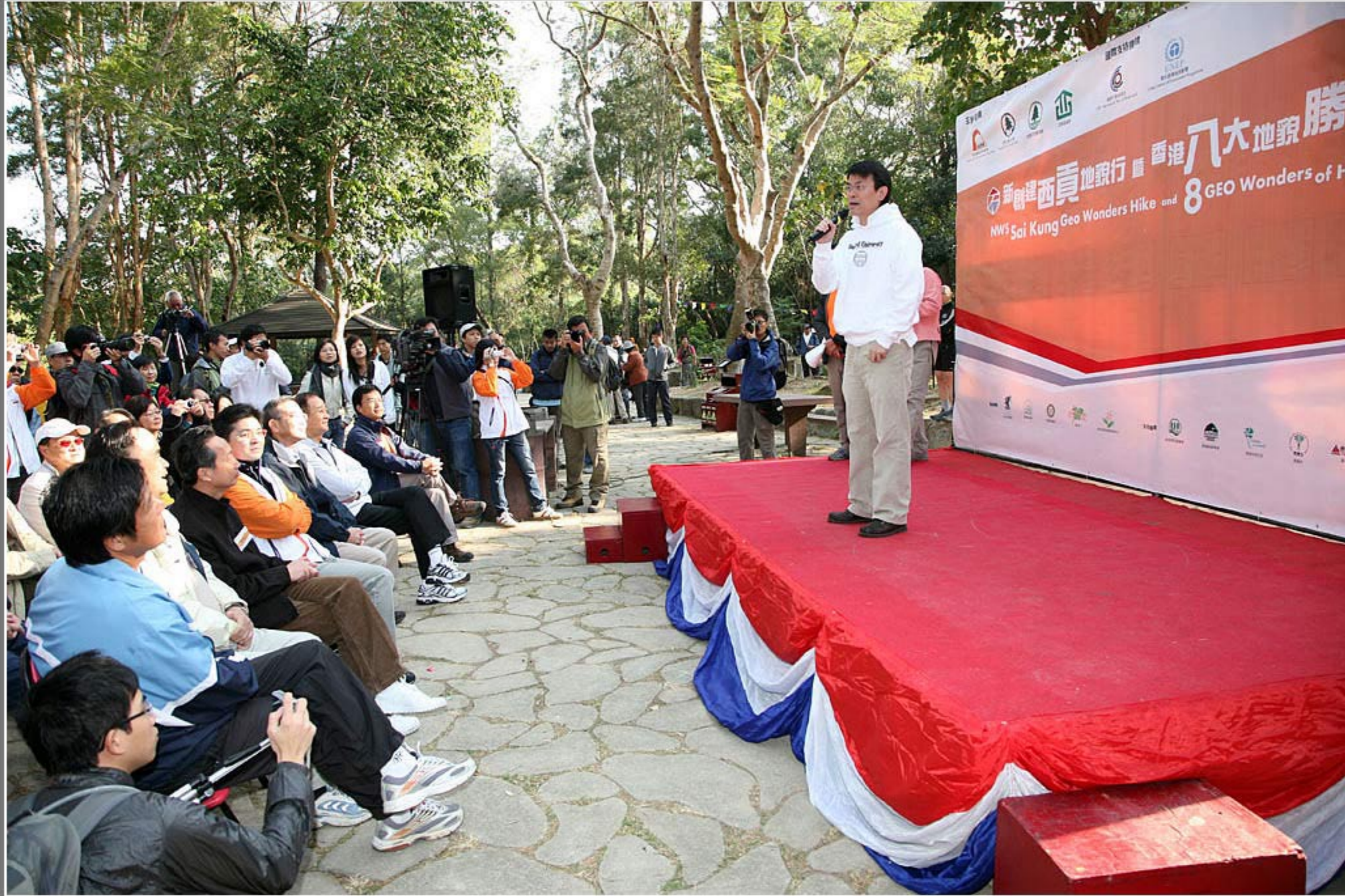
香港八大地貌勝景選舉頒獎禮暨新創建西貢地貌行典禮