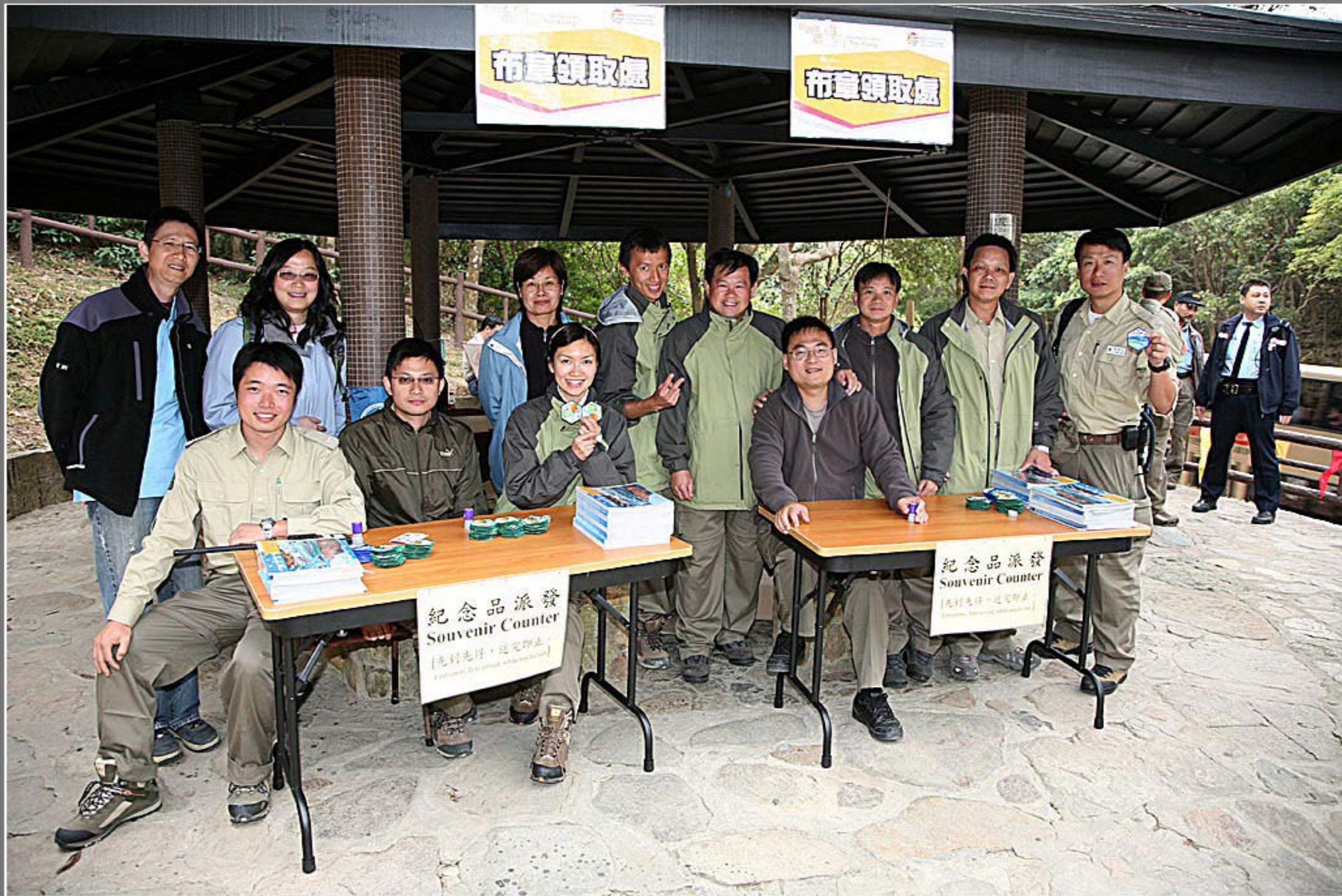
終點 - AFCD員工合照