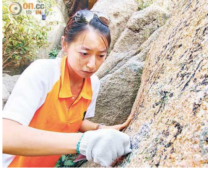
洗石天使堅持不用任何化學物料洗刷，只用沙紙和鋼絲刷刷走塗鴉。