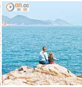
香港有不少珍貴的生態地貌。