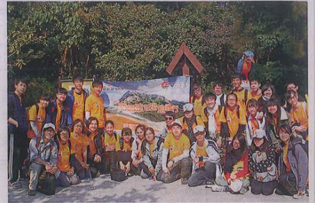
四十位「青年岩石保育大使」在十二月於「釣魚翁熔岩之旅」首次擔任導賞員，每位的臉上都流露興奮的神情。

老師的賞識，故推薦他參與保育大使計畫，他笑稱，「雖然身邊不少同學都勸我，在高考前應該專心溫習，參加這些培訓對入大學毫無幫助，但我認為有免費的機會接受專業的訓練，是一個難能可貴的機會，而且出外走走比起呆在家裏讀書，更能放鬆心情，在培訓期間，我對各種岩石的特質，掌握得更清楚，而且更學會豐富的保育知識。」