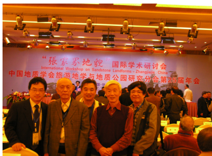
4. 吳振揚(左)、中國科學院首席火山專家陶奎元教授(左二)、前中國地質大學(武漢)地學系主任辛建榮教授(左三)及其它地質地貌專家