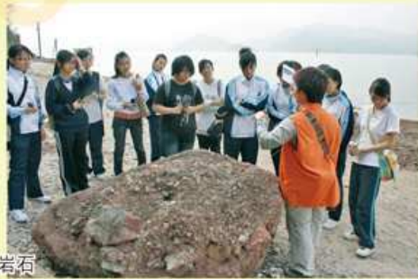
導賞員帶領中學生認識岩石

自〇六年開始，該會舉辦「洗石天使」活動，對象以中學生為主，鼓勵參加者愛護岩石，並將此信息傳遞給身邊的人。吳振揚感慨地說：「以往我們在一些美麗的遠足景點，往往看到岩石被人塗鴉，對於愛山愛石的人來說，當然感到心痛無比。」該協會最初接觸學校的老師，推介此課外活動，反應良好。活動中，導賞義工帶領參加者欣賞美麗景色，並介紹不同的岩石及岩石保育；然後，參加者展開洗石的任務，他們用水、沙紙及鋼絲刷洗擦岩石上被塗鴉的污跡。吳振揚說：「大部份參加者在分享時，均表示洗石並不容易，而且部份漆油更不能完全被清洗掉。若將來他們看到別人在岩石上塗鴉，必定會出言阻止。」