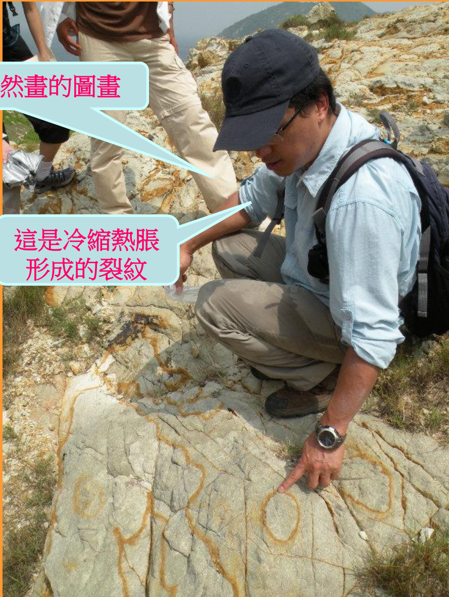
這是冷縮熱脹形成的裂紋