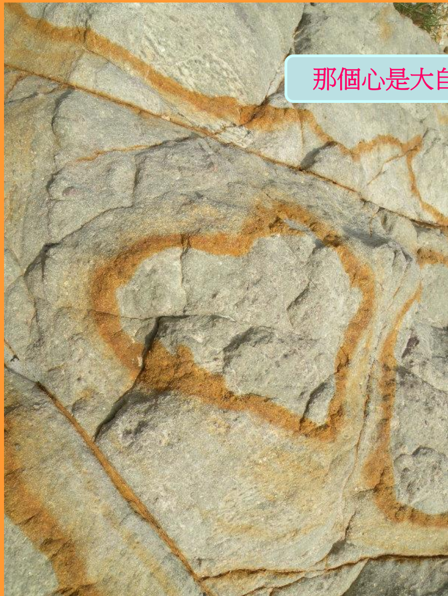
那個心是大自然畫的圖畫