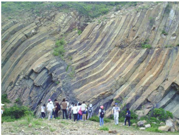
細心欣賞大自然的鬼斧神工