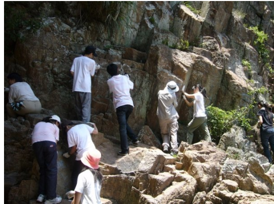
努力清洗岩石上塗鴉