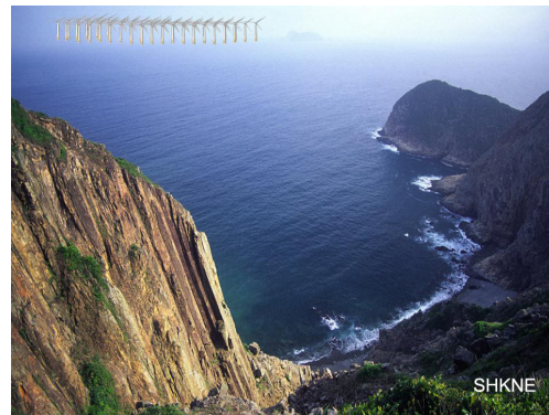
建立風電場後的模擬景觀