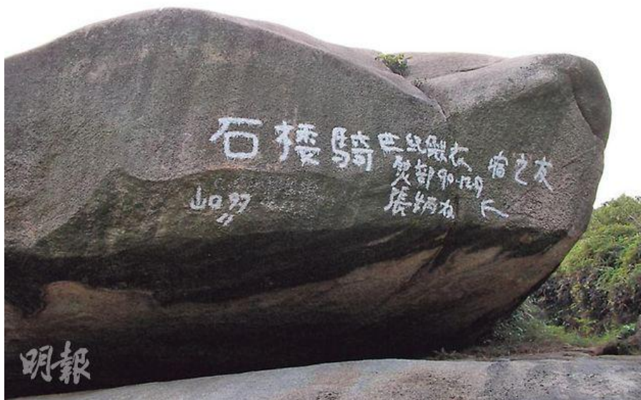
旅遊景點「南丫島騎樓石」被畫上大字，留字早出現於 1990 年。