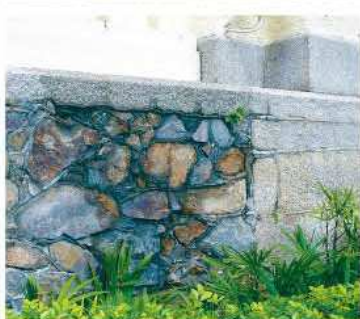
▲ 香港有很多建築物的外牆例 如昔日的最高法院（上）、伯大 尼紀念碑（中）等都會採用花崗 岩作為建築材料。