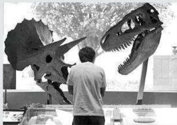
◀故事館向公眾介紹地球四十六億年的地質生態演變歷程 本報攝

故事館的開放時間為星期三至星期一上午九時至下午六時，逢星期二、農曆年初一及二休館。由十一月起，館內將安排地質公園認可導賞員提供解說。