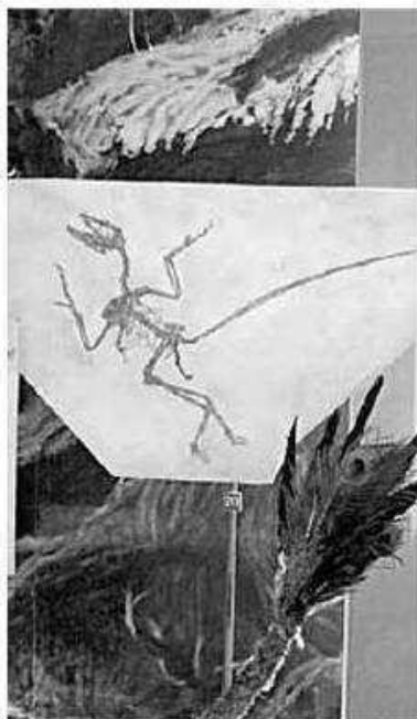
■ 史前故事館今日起開放予公眾免費參觀。

漁護署高級地質公園主任楊家明表示，市民可近距離觸摸展品，展館中庭更設有5個輕觸式屏幕，供市民以互動方式了解史前生物。他續稱，展館以顯淺及富有趣味的展覽方式，加強公眾對香港地質及古生物學的認識。故事館共分為7個不同主題的展區，由今日起免費開放予公眾，為期2年，逢周二閉館。