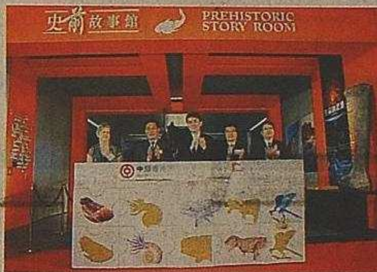
中國香港世界地質公園——史前故事館舉行開幕儀式。下圖為盾皮魚模型。

貫做法，以生動活潑的方式提高公眾的興趣。故事館於今日正式向公眾開放，開館時間為上午七時至下午六時，更將於11月開始安排專業導賞員介紹展品，詳情可瀏覽 www.geopark.gov.hk/phsr 。