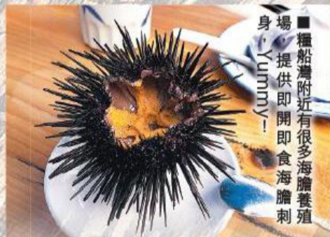
■糧船灣附近有很多海膽養殖場，提供即開即食海膽刺身 Yummy!