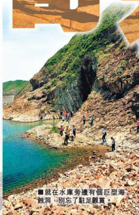
■就在水庫旁邊有個巨型海蝕洞，別忘了駐足觀賞。