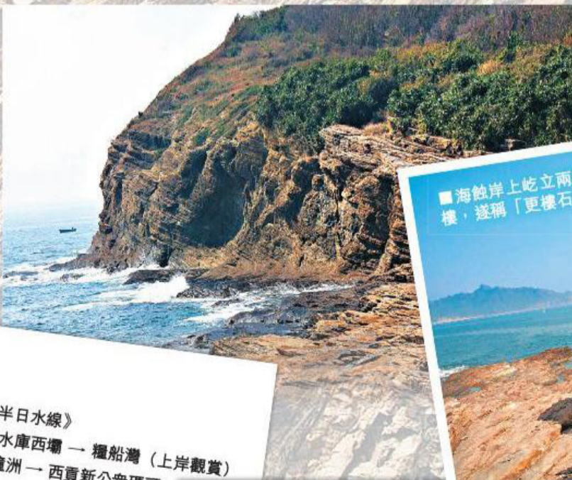
■海蝕岸上屹立兩座岩崖柱，形如古時的更樓，遂稱「更樓石」，是著名地標之一。