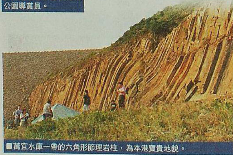
■萬宜水庫一帶的六角形節理岩柱，為本港寶貴地貌。

【本報訊】地質公園擁有獨特地貌，是市民認識地質知識的天然教室。可是，現時的地質導賞員質素參差，部份導賞員專業知識欠奉，講多錯多，有的更在帶團期間吸煙、講粗口，表現惡劣。有見及此，香港地貌岩石保育協會推出「地質公園導賞員推薦制度」，鼓勵業界提升水平之餘，亦有助市民尋找優質的導賞服務。