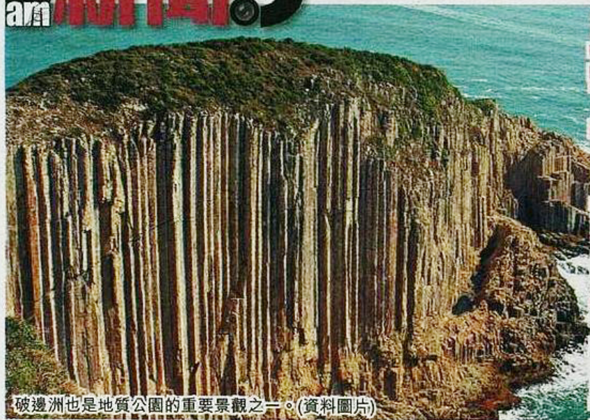
破邊洲也是地質公園的重要景觀之一。