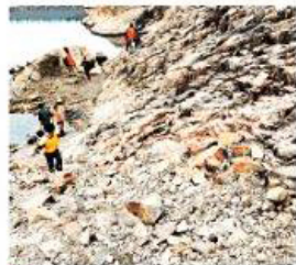
■地質公園去年十月推出，參觀者愈來愈多。