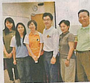
▲生態導賞員在受訓後，將成為本港首批地質公園導賞員。圖右三是香港地質岩石保育協會主席吳振揚。

此外，在遊覽期間可能發生突發事件，申請人應有危機處理技巧，最好曾接受急救、救生及攀石等訓練，而曾報讀某些社區中心及環保會的導賞員課程亦受認可。