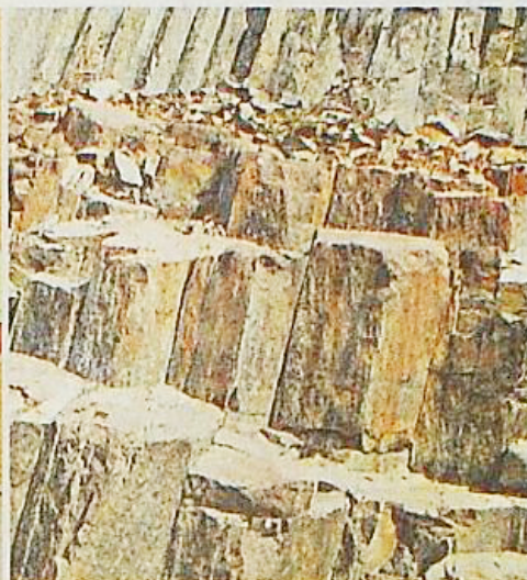
■香港的六角岩柱屬世界罕有的酸性流紋岩。