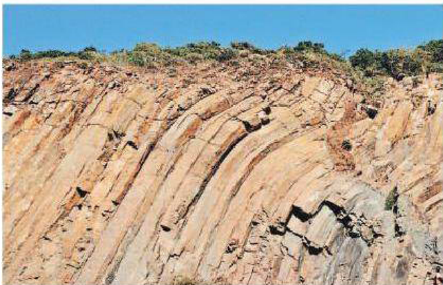
萬宜東壩附近的S形六角柱岩石，屬於凝灰岩，擁有1.4億年歷史，是香港最年輕的火山岩。(資料圖片)