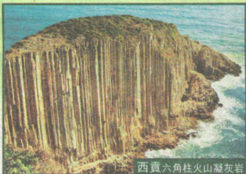
西貢六角柱火山凝灰岩