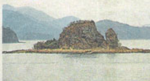
圖印洲塘擁有特殊地貌。