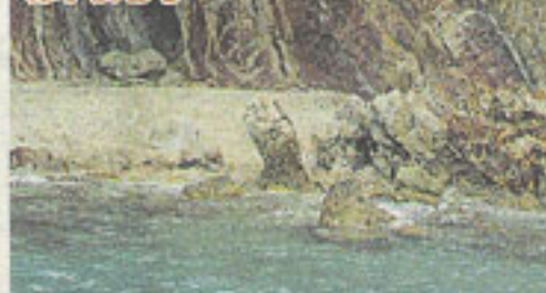
圖有四億五千萬年歷史的赤門鬼手。