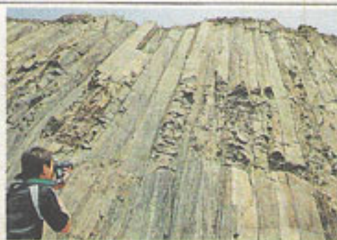
圖萬宜水庫的六角形岩柱世界罕有。

的岩石都能在新界東北部欣賞到。位於赤洲、俗稱「鬼手」的奇觀岩石有四億五千萬年歷史；而東平洲的岩石層層平疊，加上各種海蝕地貌，構成獨一無二的沉積岩景觀。而香港能看到的八種岩石，包括泥岩、粉沙岩（紅/白）、沙岩（紅/白）、頁岩、礫岩及角礫岩，全部均能在新界東北部欣賞到。