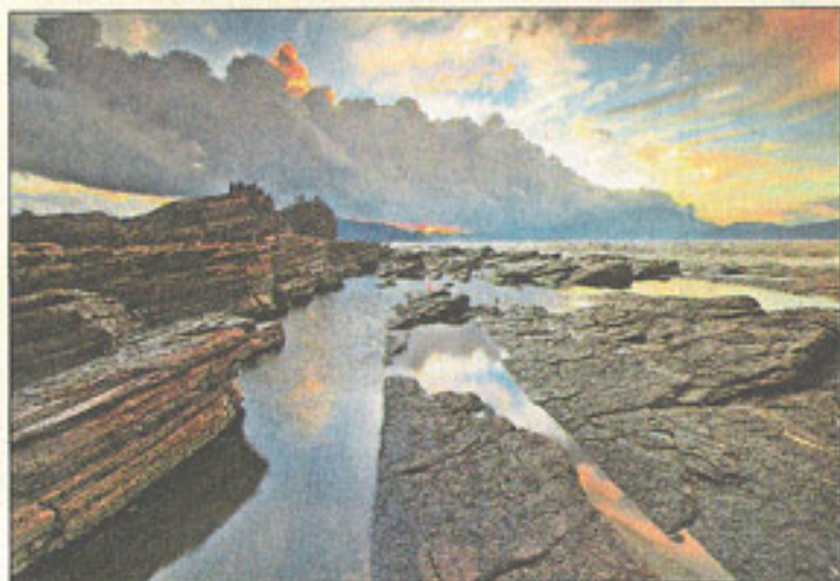
東平洲擁有香港「最年輕」的岩石，僅有6500萬年歷史，卻擁有層層疊疊的沉積岩，日出時景觀壯麗。