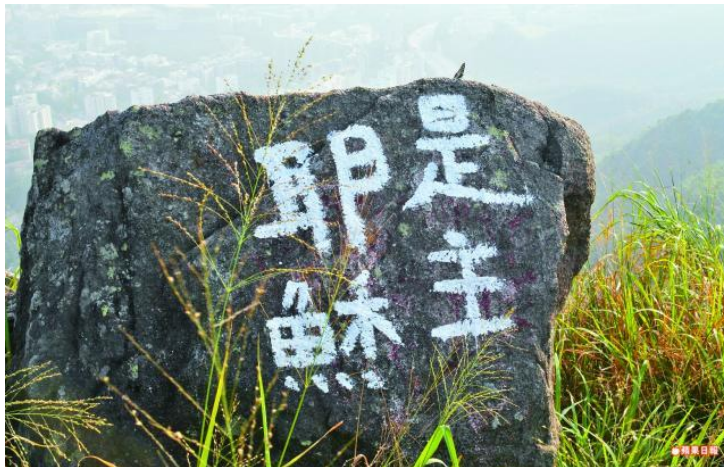
岩石被寫上「耶穌是主」。