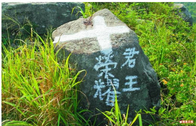
有獅子山上的岩石被「封聖」，劃上十字架並寫上「榮耀君王」字樣。