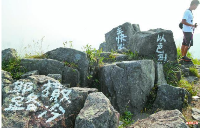
十多塊在獅子山頂的大石被塗鴉，寫上「耶路撒冷」、「以色列（列）」等字句。

晰可見。塗鴉白油的色彩仍鮮，看似剛塗上不久。記者更在塗鴉現場發現有基督教小冊子。