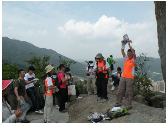
解釋望夫石被塗鴉的真實情況