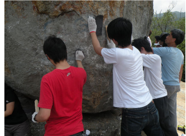
在天氣晴朗下工作