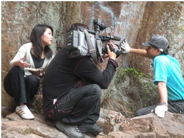
T V B 拍攝中